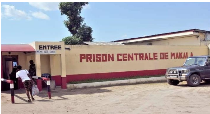
Fig. 2. Entrée de la prison centrale de Makala

La prison centrale de Makala est située à Kinshasa, la capitale de la République démocratique du Congo. Sa position géographique est stratégique pour plusieurs raisons. Premièrement, Kinshasa étant un centre urbain majeur, la prison centrale de Makala se trouve à proximité des principaux centres de décision et des forces de sécurité du pays, facilitant ainsi une intervention rapide en cas de besoin.