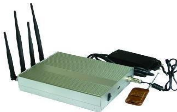
Fig. 1. Brouilleur 8341CA-5-KT

Les spécifications techniques de brouiller sont les suivants: