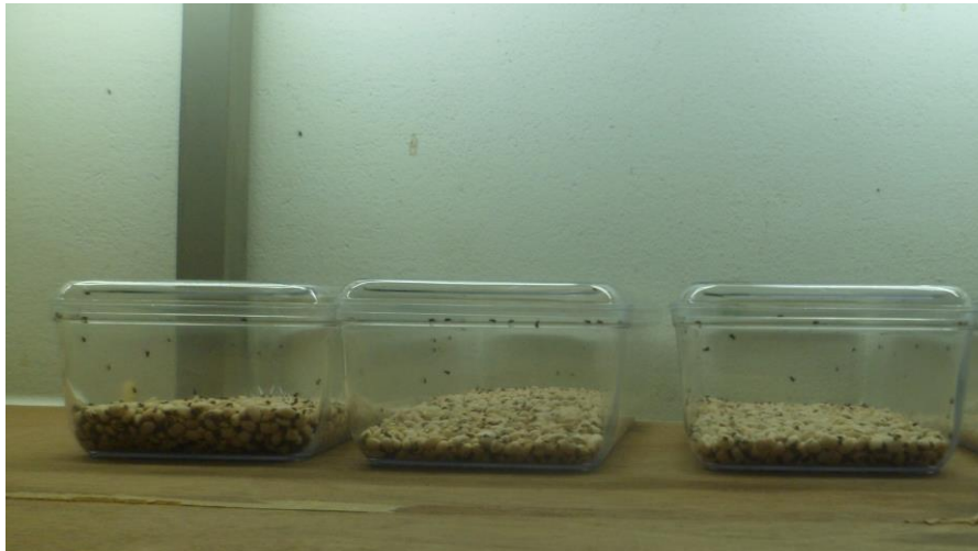
Fig. 3. Dispositif d'élevage de C. maculatus au laboratoire (Nafissatou, 2023)