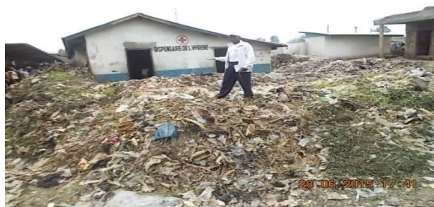
Fig. 1. Décharge incontrôlée du marché central de Mbandaka II