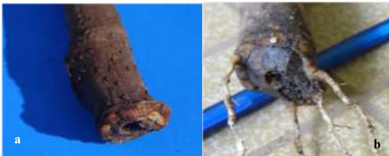
Fig. 4. Enracinement des boutures: formation de cals (a) et de racines (b) chez certaines boutures ayant débouffées

Les valeurs suivies de la même lettre ne sont pas significativement différentes à 5 % dans une colonne.