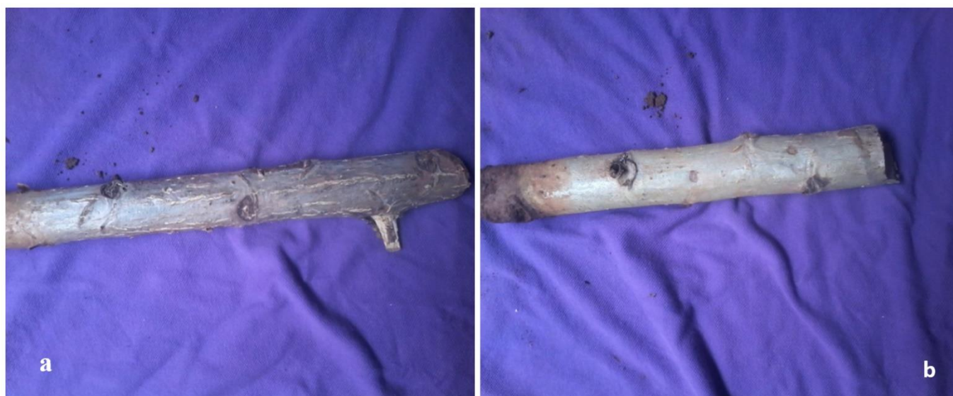
Fig. 1. Bouture aotée (a) et bouture semi-aotée (b) prélevées sur un arbre adulte de Ricinodendron heudelotii var. heudelotii

la lignine est bien formée. Un total de 540 boutures a été prélevé. Chaque bouture porte au moins un nœud et mesure 14 cm de long ( Figure 1 ).