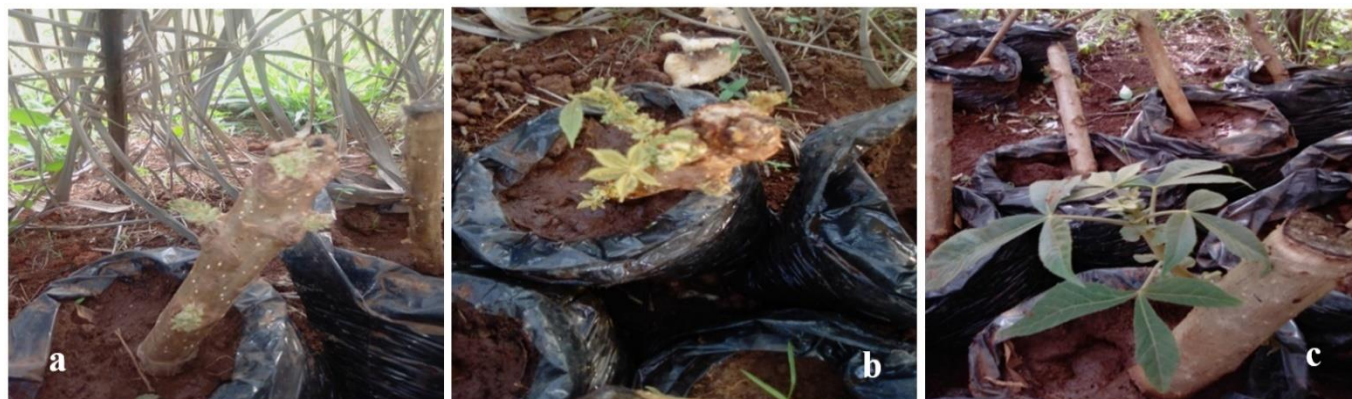
Fig. 3. Reprise de croissance des boutures de Ricinodendron heudelotii : a- Formation du bourgeon axillaire, b- Développement du pétiole et apparition des premières feuilles de la jeune tige, c- Formation des feuilles composées palmées disposées en spirale autour de la jeune tige