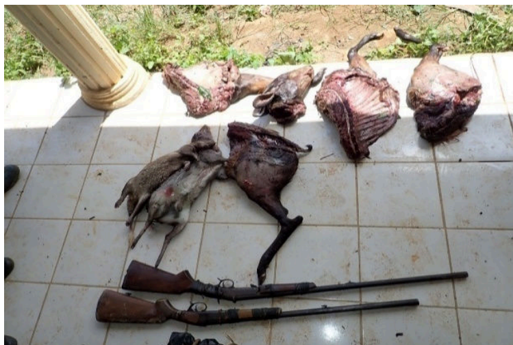
Photo 1. Résultats d'une mission de LAB effectuée avec la brigade nationale de contrôle au Parc de KOM