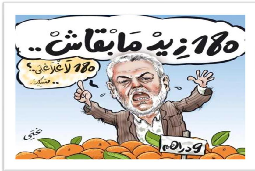
Fig. 1. Caricature N° 1