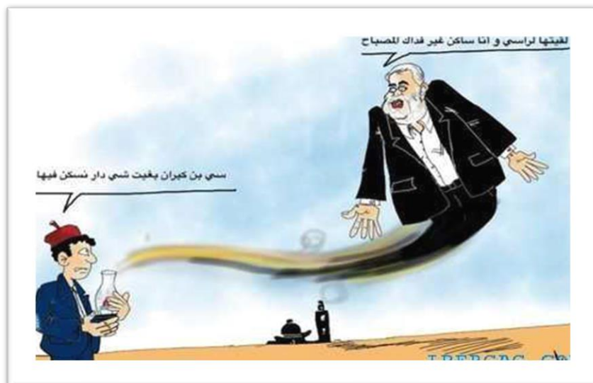
Fig. 2. Caricature N° 2