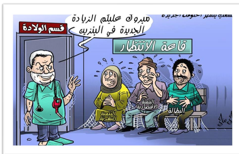
Fig. 3. Caricature N° 3