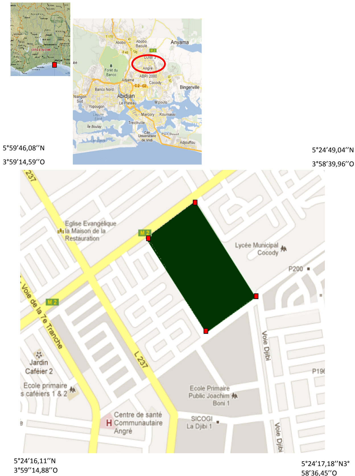
Fig. 1. Plan de la zone d'Angré-Djibi montrant le site d'étude.