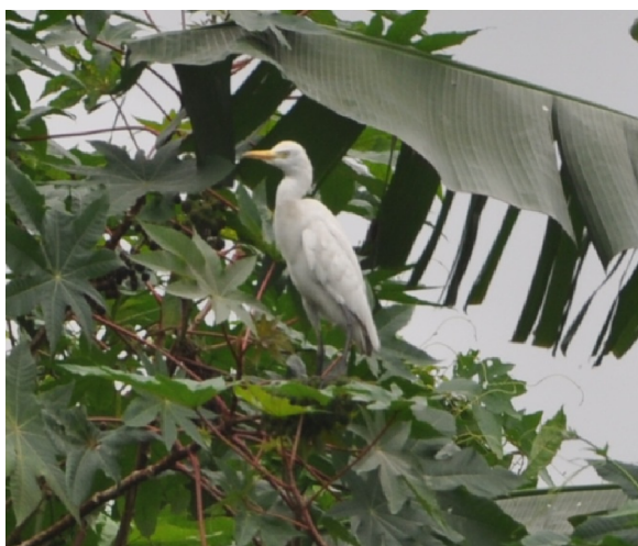
Fig. 5. Héron garde-bœuf Bubulcus ibis

Les relevés avifauniques sur notre site d'étude ont permis d'inventorier 73 espèces réparties en 54 genres, 32 familles et 14 ordres (Tableau I). L'ordre des Passeriformes, avec 30 espèces de 13 familles est le mieux représenté. Chez les oiseaux non Passeriformes l'ordre des Ciconiiformes avec huit espèces est le mieux représenté. Ensuite, suivent l'ordre des Charadriiformes avec sept espèces, l'ordre des Coraciiformes avec cinq espèces et l'ordre des Falconiformes avec trois espèces. Les ordres les moins représentés sont ceux des Podicipediformes, des Anseriformes, des Galliformes et des Musophagiformes avec une espèce chacun. Les figures 5 à 10 présentent les images de quelques unes des espèces observées.