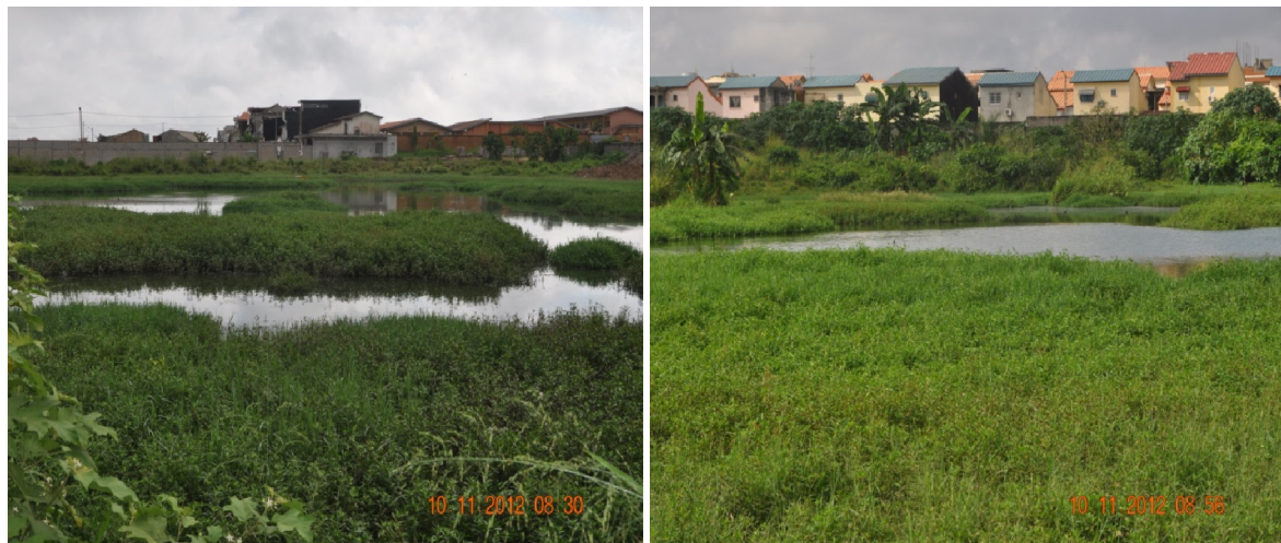
Fig. 3. Vues de la zone marécageuse (ZM)