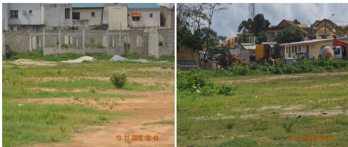
Fig 4. Vues de la zone de construction (ZC)