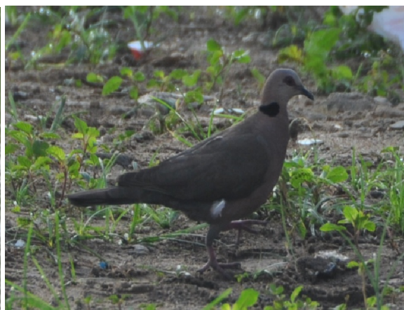
Fig. 8. Tourterelle à collier Streptopelia semitorquata