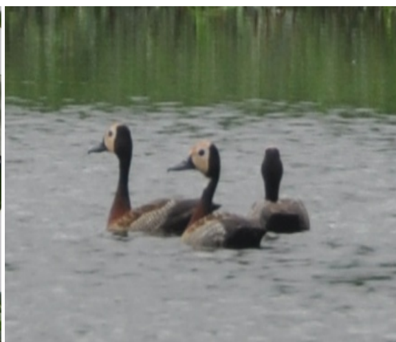
Fig. 6. Dendrocygne veuf Dendrocygna viduata