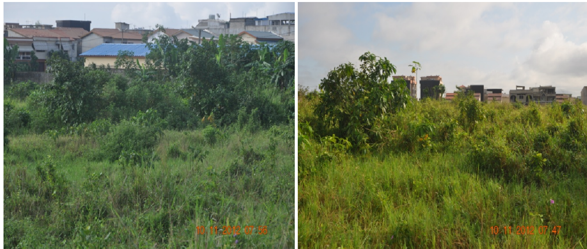
Fig. 2. Vues de la zone de jachère (ZJ)