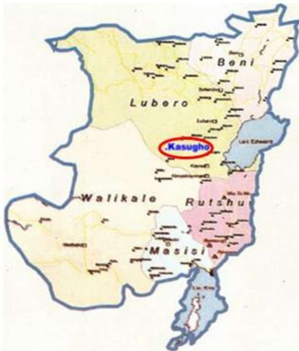
Fig. 1. Localisation de Kasugho en Province du Nord-Kivu