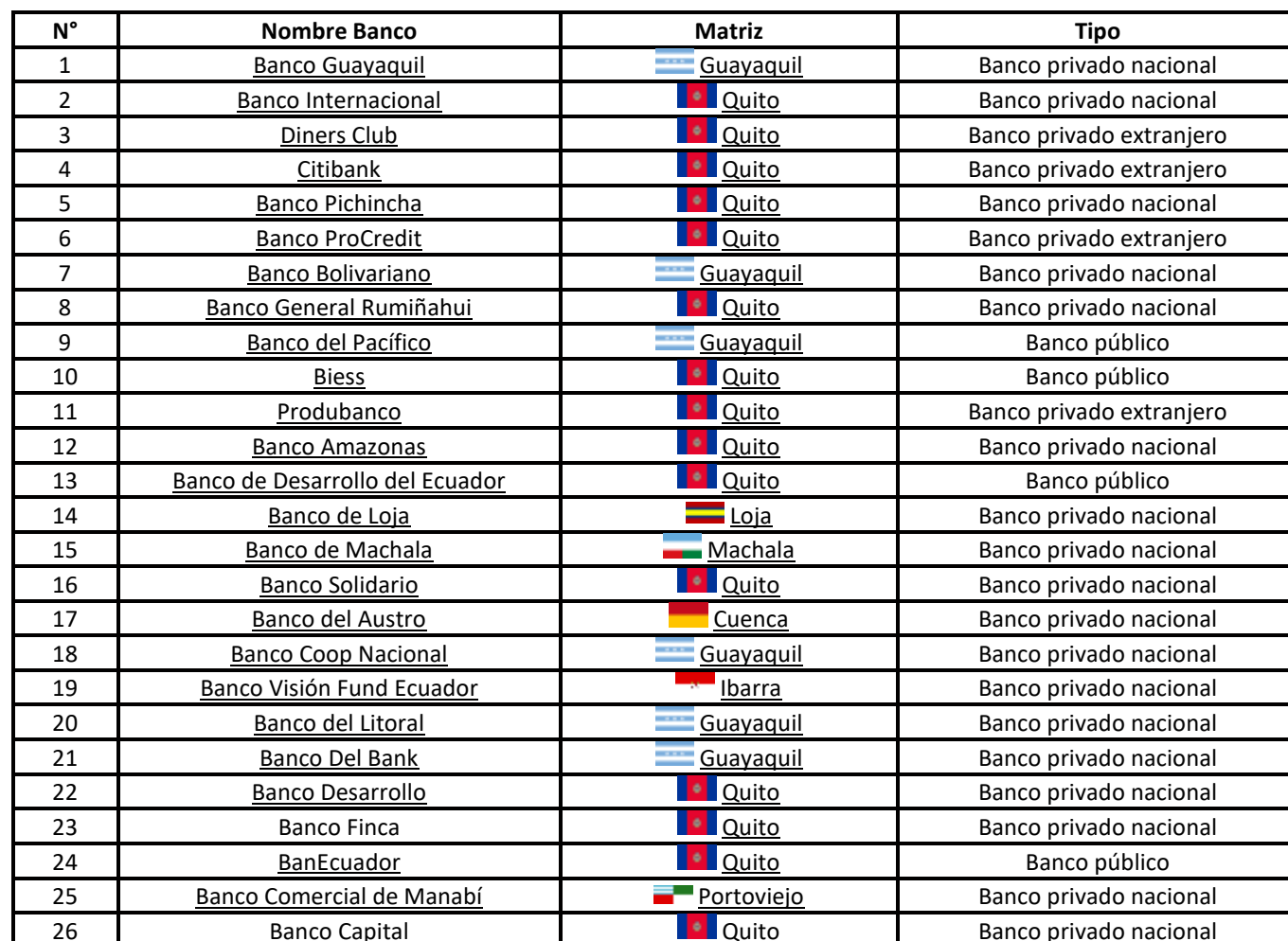
Tabla 1. Bancos Del Ecuador