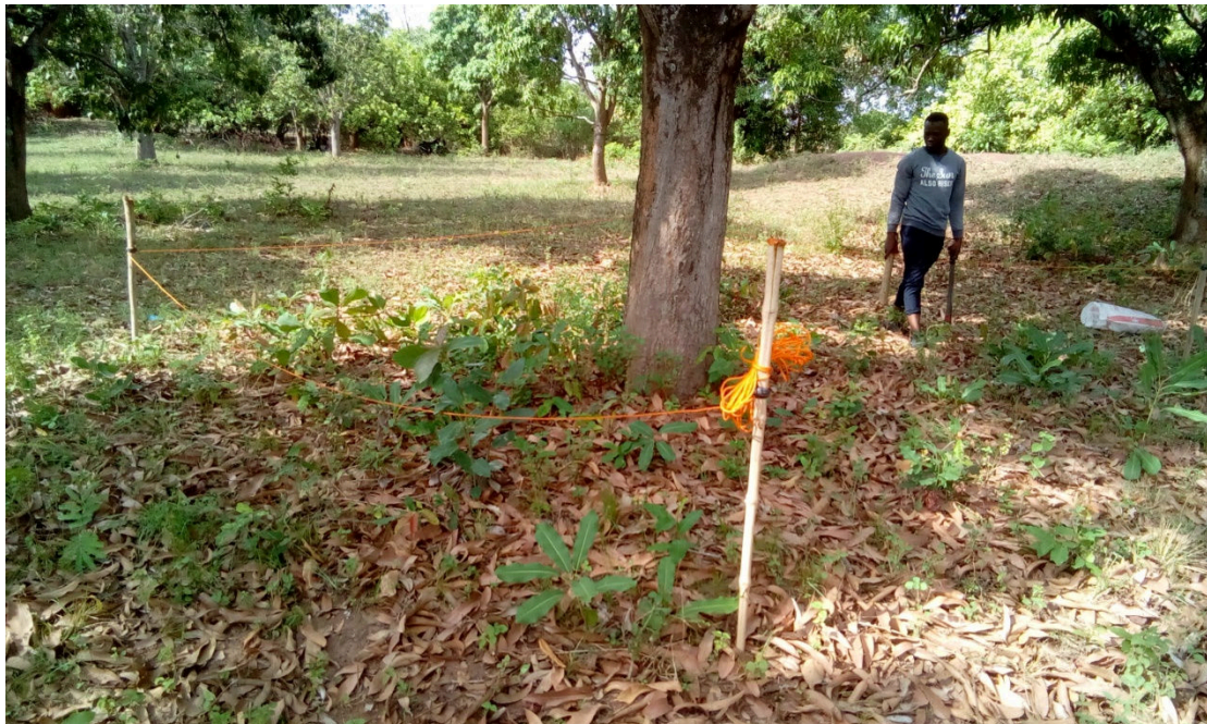
Fig. 2. Délimitation des placettes pour relevés phytoécologiques

Ainsi, une espèce dont la contribution spécifique est inférieure à 1 est très peu productrice de biomasse, tandis que celle dont la CsF est supérieure à 4 est très productrice.