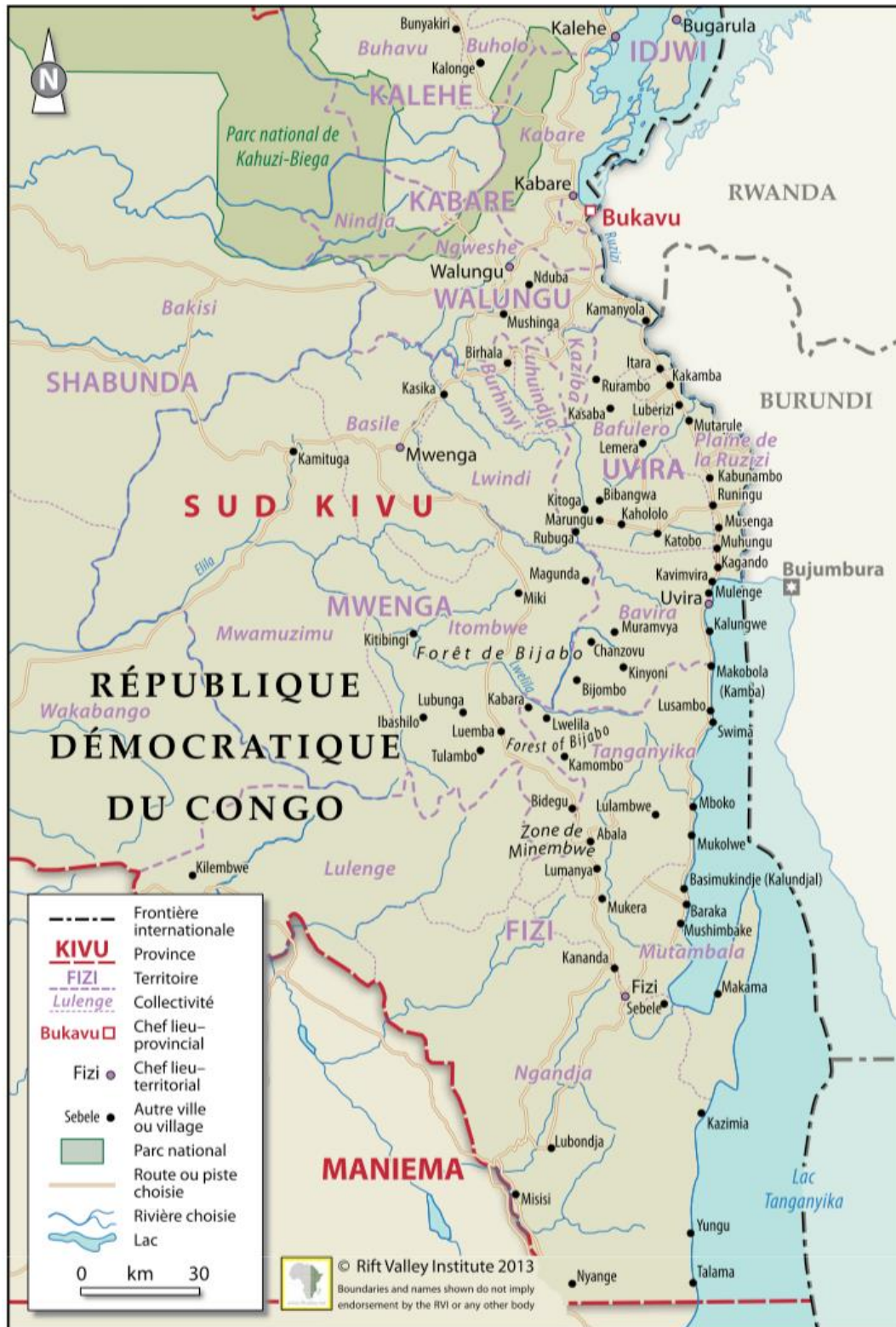
Fig. 1. Territoires, collectivités et principales villes du Sud-Kivu