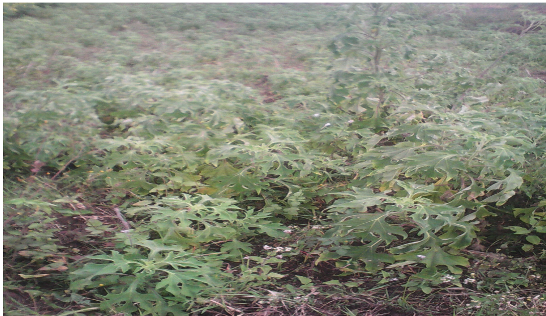
Fig. 1. Tithonia diversifolia en végétation