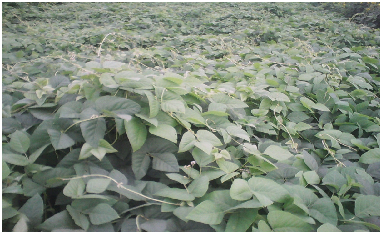
Fig. 3. Mucuna preta en pleine végétation

Cette herbe utilisée comme engrais vert, peut aussi servir comme fourrage. Il est très efficace dans la lutte contre les mauvaises herbes [12] et est conseillé pour une jachère de longue période. Il est aussi utilisé comme plante conservatrice du sol sur les terrains en pente.