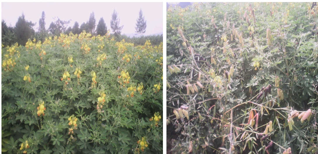
Fig. 4. Crotalaria grahamiana et Crotalaria ochroleuca

Ce sont des engrais verts sous forme des plantes arbustives souvent utilisées comme haies coupe-vent entre d'autres plantes. Pour une fixation maximale de l'Azote, ils sont semés assez serrés, la densité de semis doit être plus élevée que quand cette plante est utilisée pour ses graines. Ils utilisent l'Azote de l'air [13].