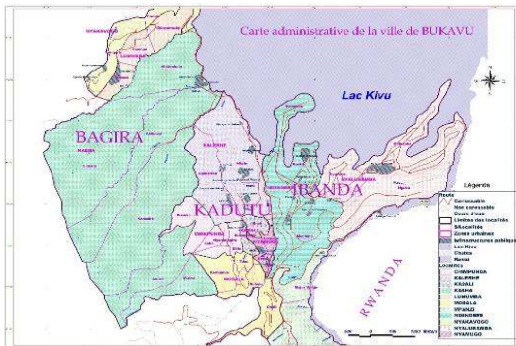
Fig. 1. Carte administrative de la ville de Bukavu.

La population de la Ville de Bukavu (Figure 1), en 2014 par communes est reprise dans le tableau (1).