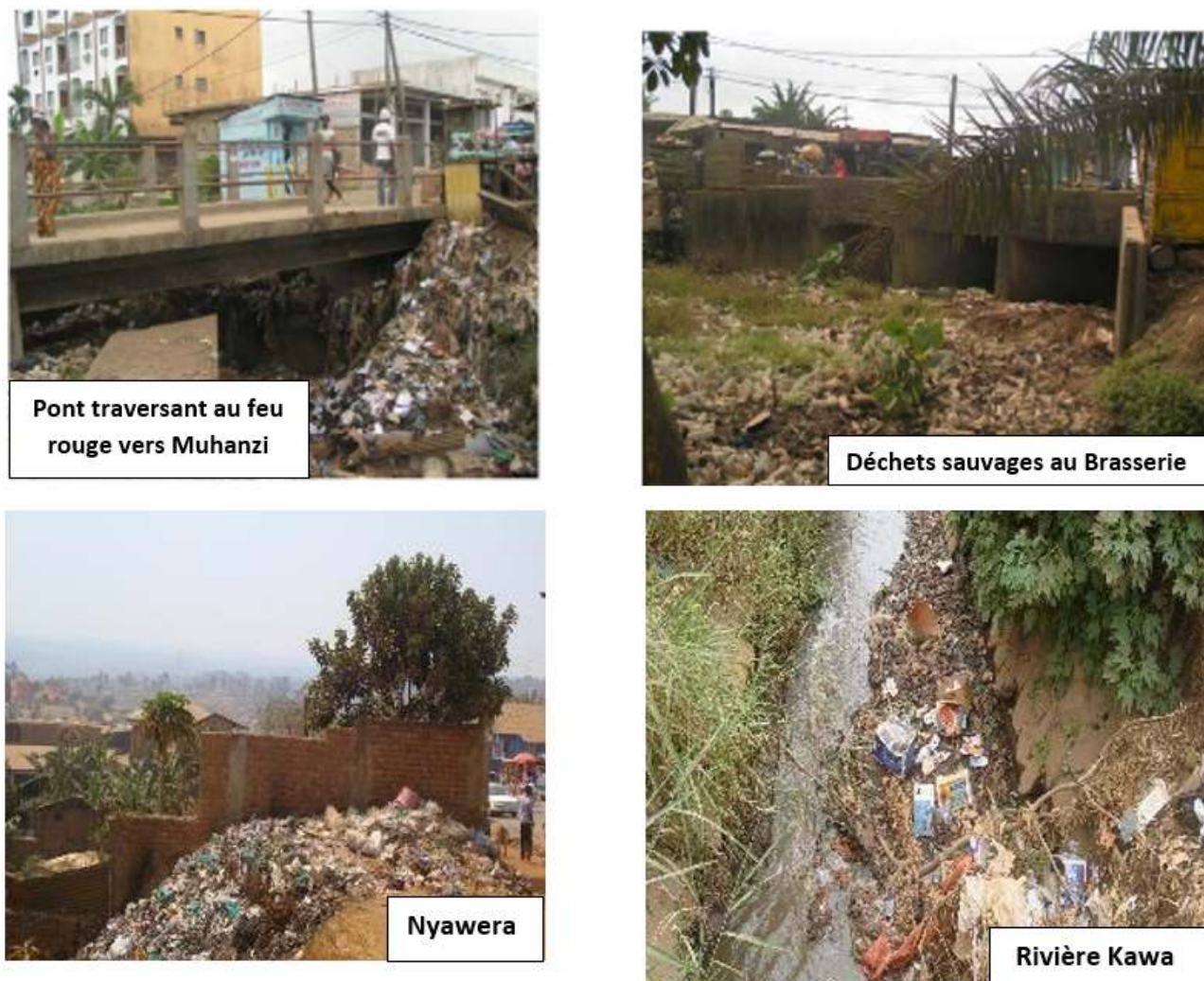
Fig. 4. Décharges sauvage dans la ville de Bukavu.

Là où elles existent, elles sont plus que sauvages c'est-à-dire non installées par le pouvoir publique (Figure 4).