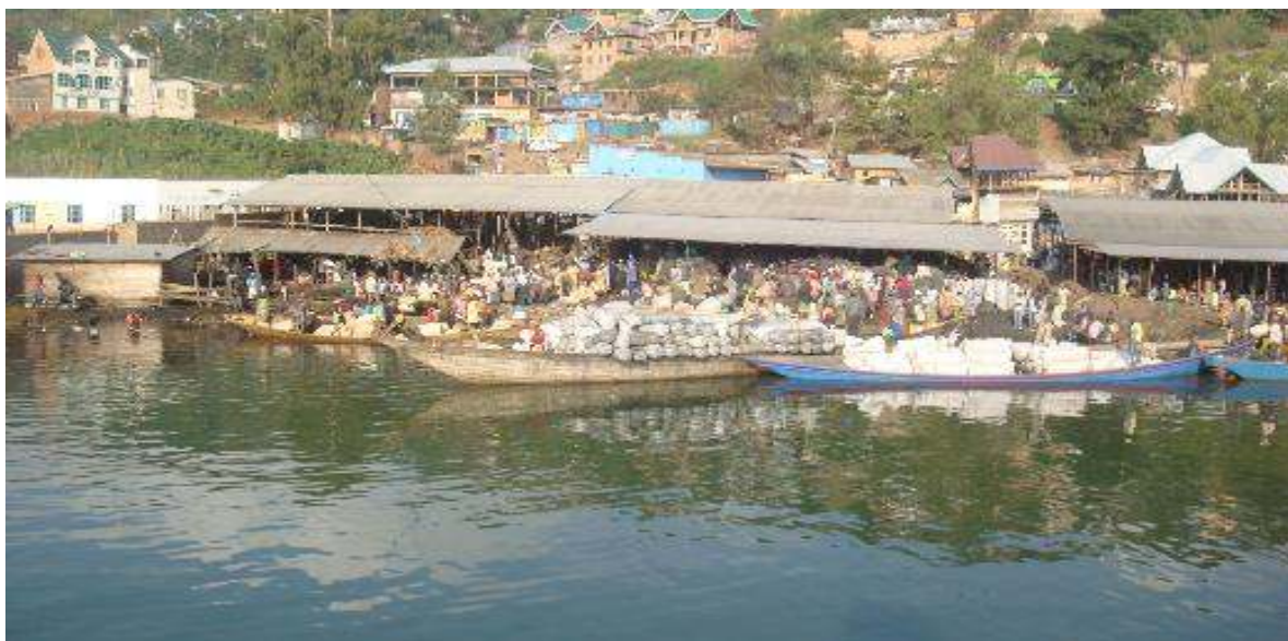
Fig. 2. Couleur des eaux du Lac Kivu affectée par la pollution.

Diverses études ont mis en évidence des différences de composition chimique des eaux entre la zone littorale et le milieu pélagique, d'où l'estimation des pigments chlorophylliens qui confirment donc bien les différences de biomasse phytoplanctonique entre stations côtières et pélagiques du Lac Kivu qui sont belle et bien visibles par la population riveraine (Figure 2).