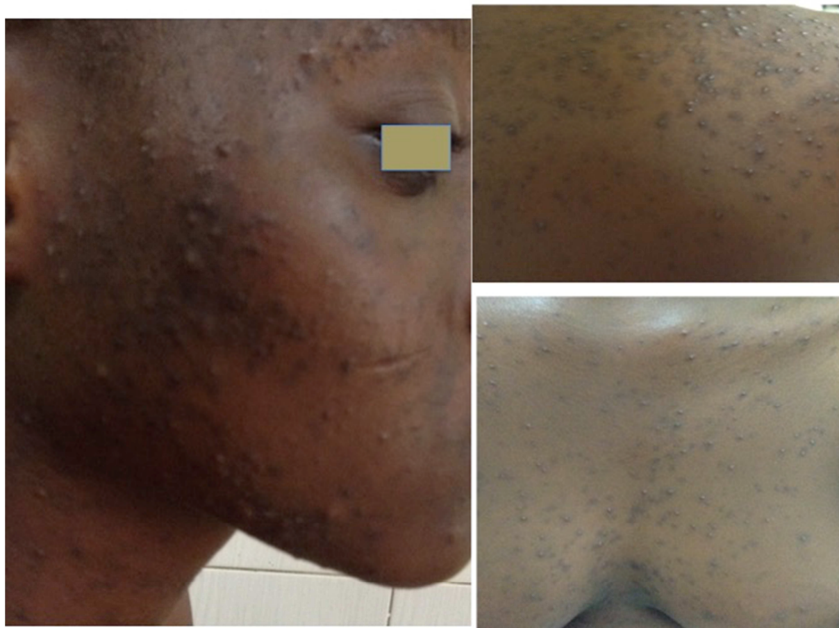
Fig. 1. Iconographie montrant des lésions d'acné du visage, du dos (en haut à droite) et de la poitrine (en bas à gauche)

L'acné était jugée légère à modérée chez 95,43% (167/175) des élèves acnéiques et sévère chez 4,75% (8/175). Le score de sévérité globale ECLA était en moyenne de 5,84 \pm 3,62 avec des extrêmes compris entre 0 et 21. Les scores F1, F2, F3 de la grille ECLA sont présentés dans le tableau II.