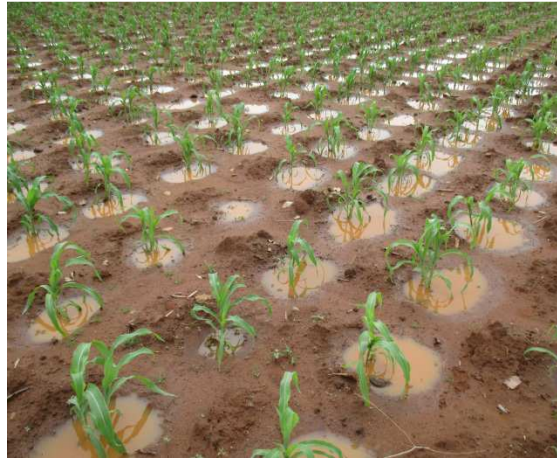
Figure 1: Sorgho dans les poquets de zaï+eau