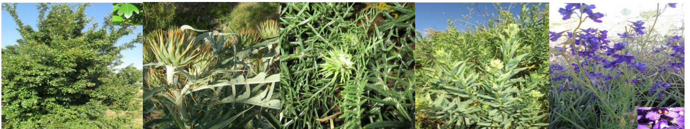
A36 : Crataegus monogyna