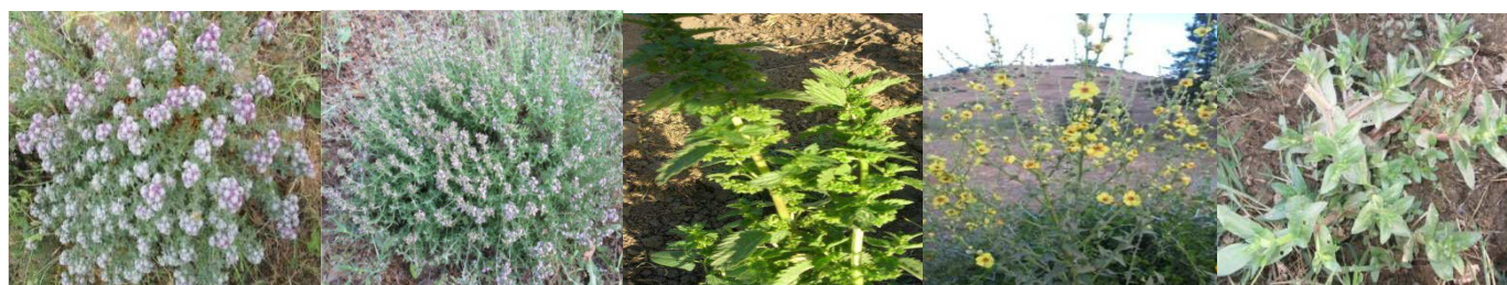
A96 : Teucrium polium