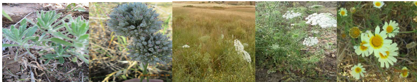
A1 : Ajuga iva