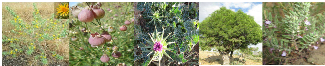
A91 : Scolymus hispanicus