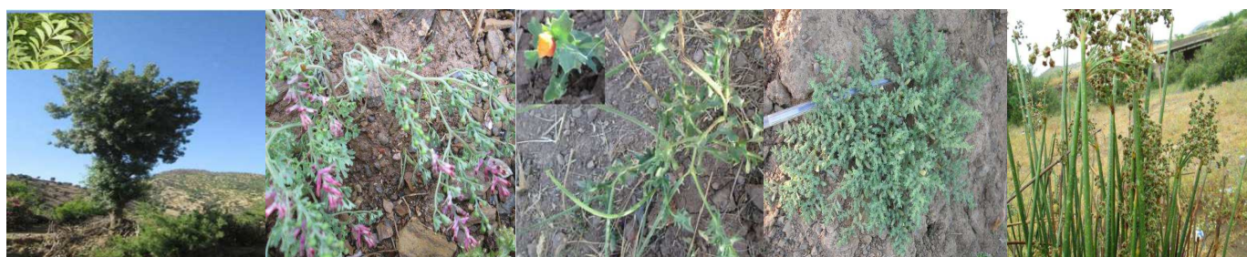
A51 : Fraxinus angustifolia