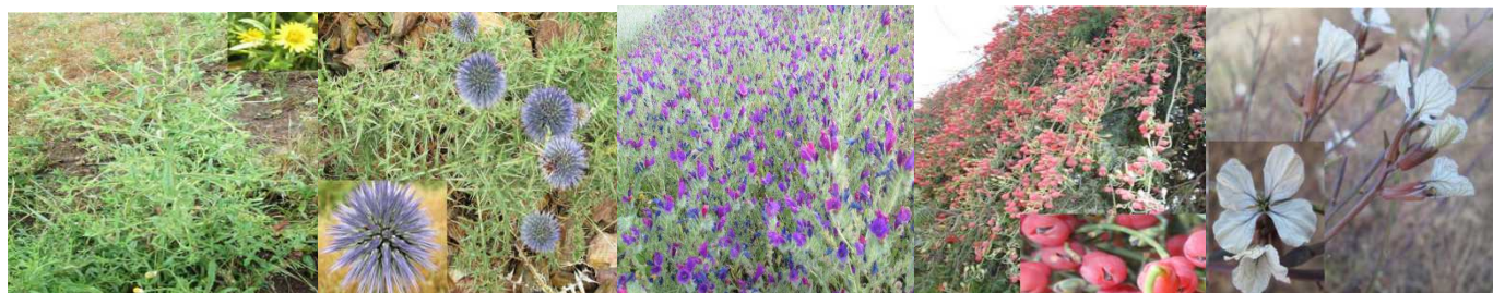
A41 : Dittrichia graveolens