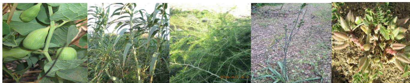
A11 : Aristolochia paucinervis