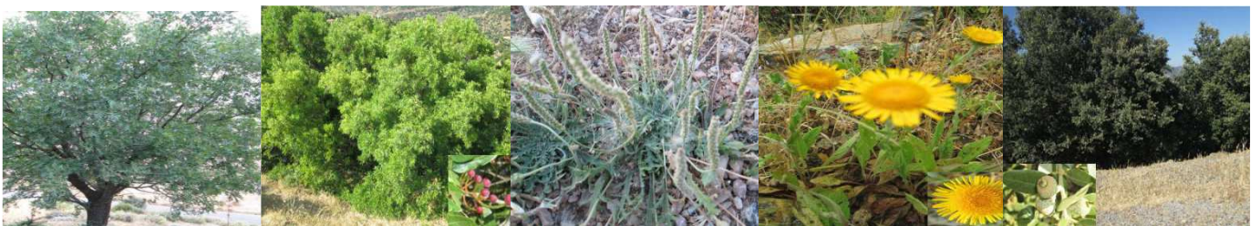
A76 : Pistacia atlantica