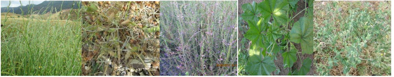
A61 : Lolium rigidum