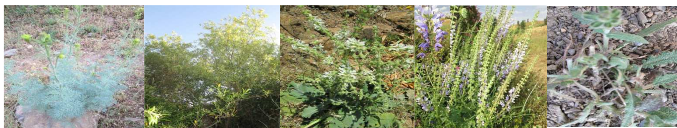
A86 : Ruta montana