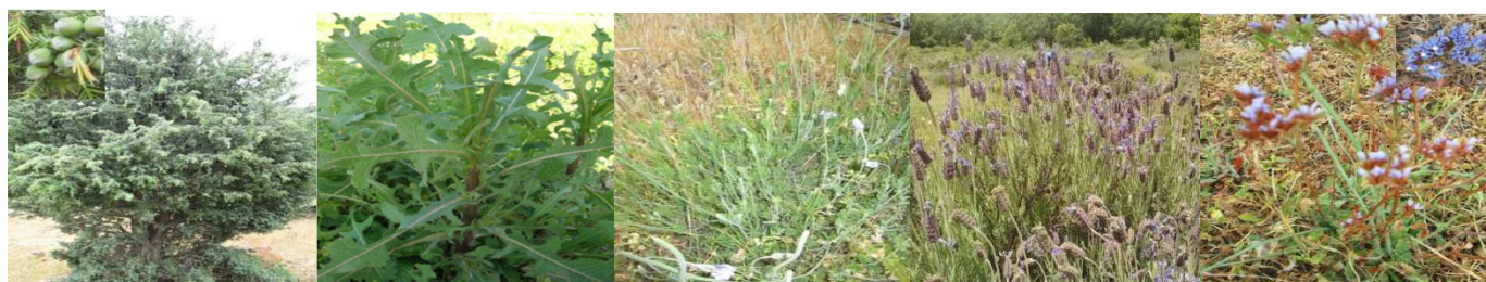
A56 : Juniperus oxycedrus