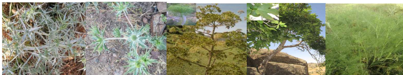
A46 : Eryngium triquetrum