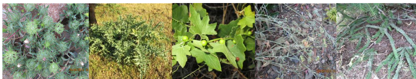
A16 : Atractylis cancellata