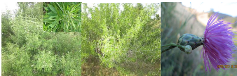
A101 : Vitex agnus castus