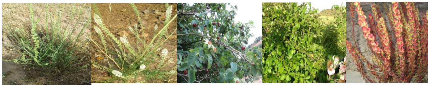
A81 : Reseda luteola