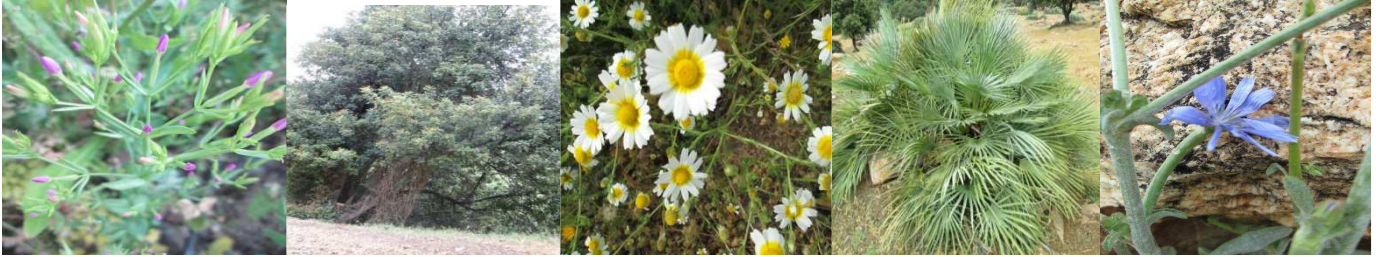
A26 : Centaurium pulchellum