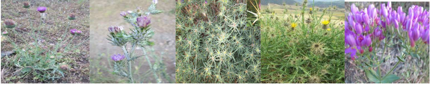
A21 : Carduus nutans