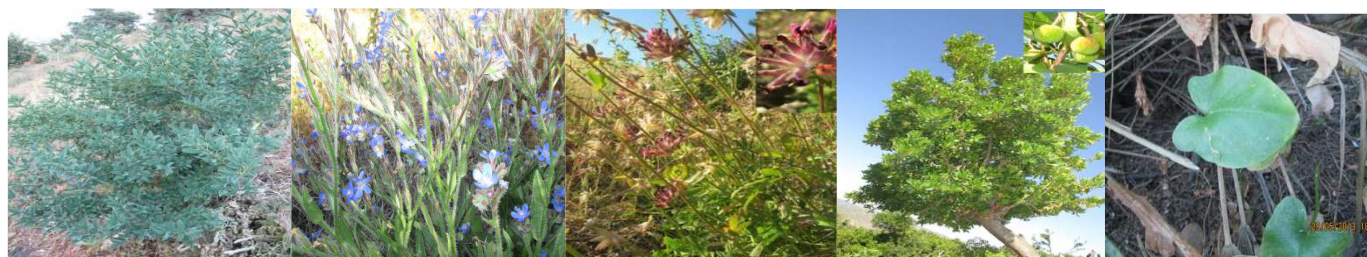
A6 : Anagyris foetida