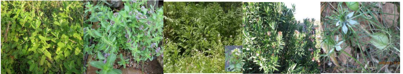
A66 : Mentha suaveolens