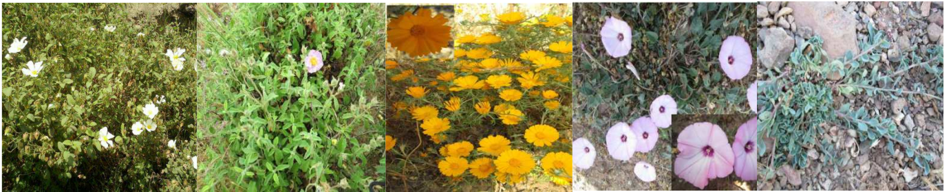
A31 : Cistus salviifolius