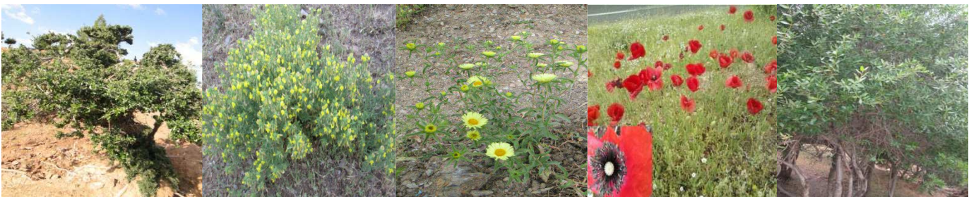
A71 : Olea europaea