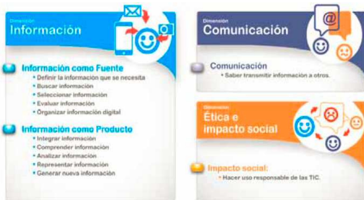
Figura 1. Habilidades medidas por el SIMCE TIC.

El uso de las TIC es una política gubernamental (SIMCE y Red ENLACES) desde finales de la última década del siglo pasado según la referencia 10 se plantea la existencia de “... una demanda de educación superior muy distinta...”. De ahí que en 2011 se desarrolló la prueba SIMCE TIC como parte de la verificación de nuevas competencias en el alumnado. Se puede apreciar la necesidad de preparar a los Docentes para alcanzar las metas propuestas por estos planes gubernamentales. La siguiente gráfica está tomada del informe “Desarrollo de habilidades digitales para el Siglo XXI en Chile” [11]